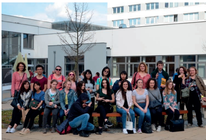
Studenti Gymnázia Mozartova