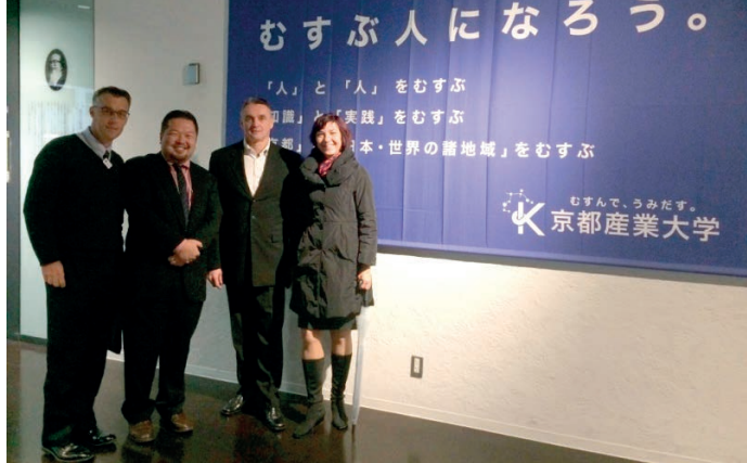
Kyoto Sangyo University