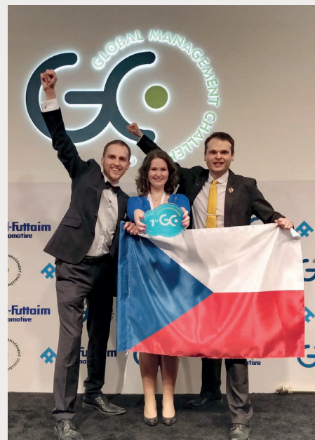
Tým Answer 42 zvítězil ve hře Global Management Challenge