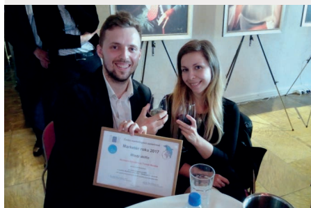
Studenti FES a Mladý Delfín

Ve fiktivní burzovní hře Studentbroker dosáhli studenti z Fesky na devět z deseti hodnocených míst. Všem studentům gratulujeme a děkujeme za účast a reprezentaci na těchto prestižních akcích. Vedení fakulty podporuje rozvoj mezinárodní spolupráce fakulty, studenti i zaměstnanci fakulty vyjíždějí na zahraniční školy a pracoviště. Např. Ing. Jirava absolvoval pracovní cestu do sídla Evropského parlamentu ve Štrasburku.