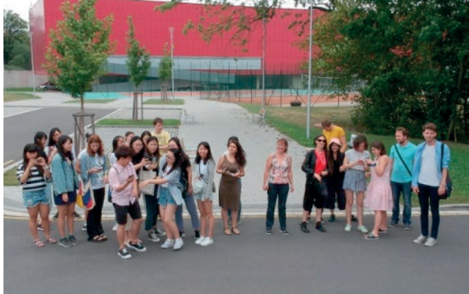
Summer School of the University of Pardubice