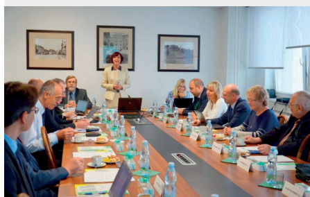
Vědecká rada FES, projednávání akreditačních spisů