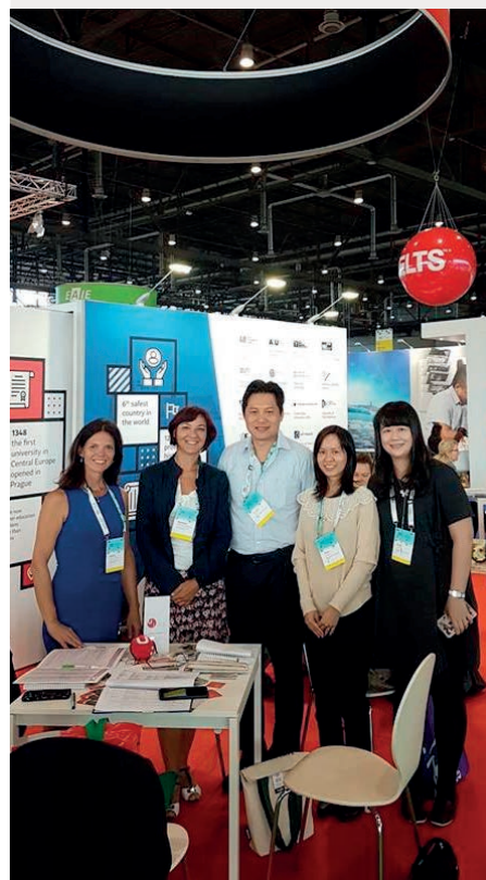
EAIE mezinárodní konference v Ženevě

vala jeden prázdninový týden na naší fakultě v rámci měsíční letní školy „European Studies and Governance“. Během letní školy si rozšířili znalosti, poznali Evropu reálně i přes pohled různých vědních disciplín a prožili léto u nás, v České republice. Naše fakulta si připravila pásmo přednášek a workshopů na téma veřejné správy v ČR, Evropské unie nebo geografických informačních systémů.