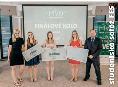
studentská soutěž FES