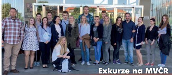
Exkurze na MVČR