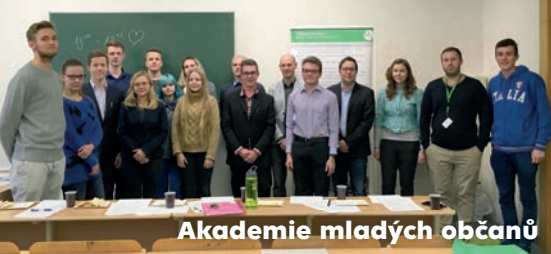
Akademie mladých občanů